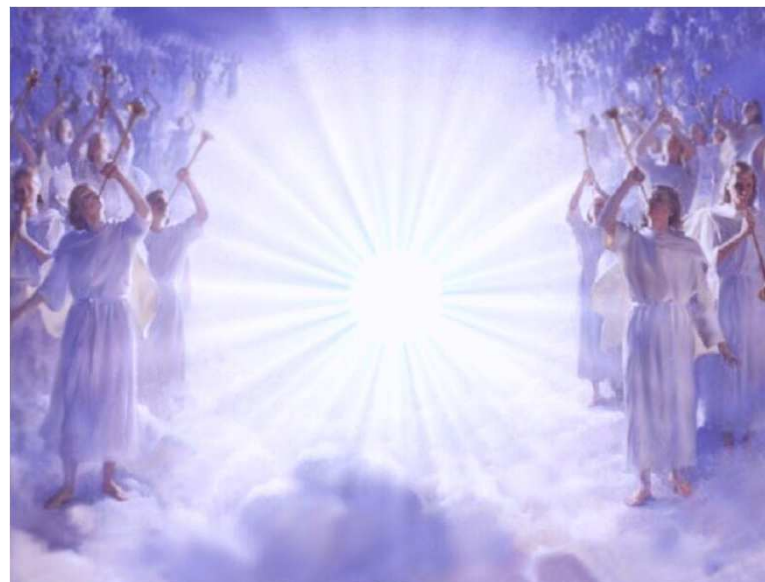
Legiões de Anjos

Dizendo Jesus que se quisesse receberia auxílio de doze legiões de anjos contra os que o perseguiram, quis demonstrar aos homens que podemos escapar da justiça terrena, mas jamais poderemos iludir a justiça divina. É verdade que Jesus não estava no caso de um espírito em provas ou em expiação, não tendo culpas a resgatar, fora declarado culpado unicamente pelos sacerdotes. Ele recusou livrar-se dos homens porque, como Missionário celeste que era não quis renunciar à sua missão. Ele compreendia que se não se submetesse, o seu Evangelho de Amor, Renúncia, Sacrifício, Bondade, Tolerância, Humildade, Perdão e Submissão às leis divinas e humanas, não teria valor para a posteridade.