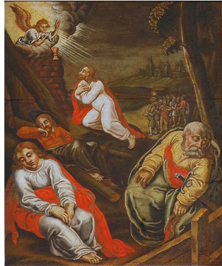
Jesus na companhia de Pedro, João e Tiago

Na hora difícil, Jesus buscou o conforto de seus amigos, e recursos na oração. Conquanto ele já fosse um espírito evoluído, angustiou-se também, mas não se desesperou, nem se isolou, nem se lamentou. Fazendo-se acompanhar de amigos, ele nos ensina que uma pessoa que se isola, não pode progredir. O progresso só é possível quando há auxílio mútuo. Somente quando orava e quando se entregava à meditação é que Jesus ficava só, fora disso, gostava de estar na companhia dos Apóstolos e de quantos o procuravam.