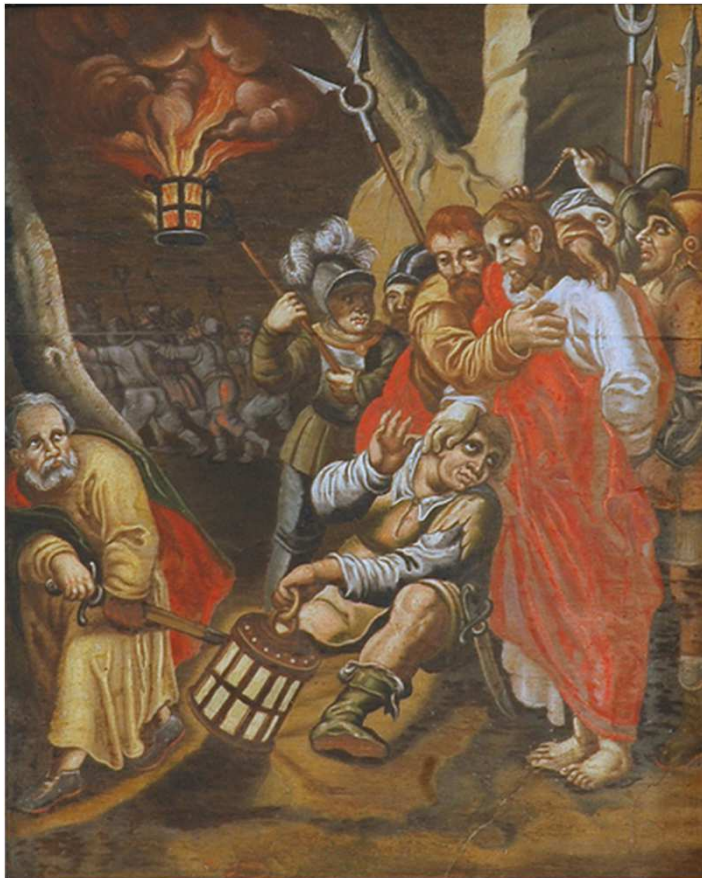
Pedro fere Malco servo do sumo sacerdote

Consciente de sua missão de instruir seus irmãos menos evoluídos, Jesus não perde as oportunidades. Ao gesto de violência que Pedro executou para defendê-lo, o Mestre lhe responde com o ensinamento profundo do choque de retorno: Quem com ferro fere, com ferro será ferido, ou o que fizeres aos outros, isso mesmo te estará reservado. Com isto Jesus nos ensinou que, cedo ou tarde, receberemos o reflexo das ações que tivermos praticado contra nosso próximo. O bem jamais ficará sem recompensa, e o mal nunca deixará de ser castigado, seja qual for a espécie dele, a situação e a ocasião em que foi cometido.